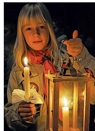
Am Sonntag in Merzig: das Friedenslicht.

eines Merziger Pfadfinderstammes werden. „Wir als ehemalige Pfadfinder haben den Verein ‚Freunde und Förderer der deutschen Pfadfinderschaft St. Georg im Saarland‘ maßgeblich betrieben, um einen neuen Stamm in Merzig wieder ins Leben zu rufen“, sagt Diwersy. Um das Friedenslicht sicher heimtragen zu können, empfiehlt er, eine windgeschützte Laterne mitzubringen. Eine solche Laterne kann gegen ein geringes Entgelt in der Kirche erworben werden. mst