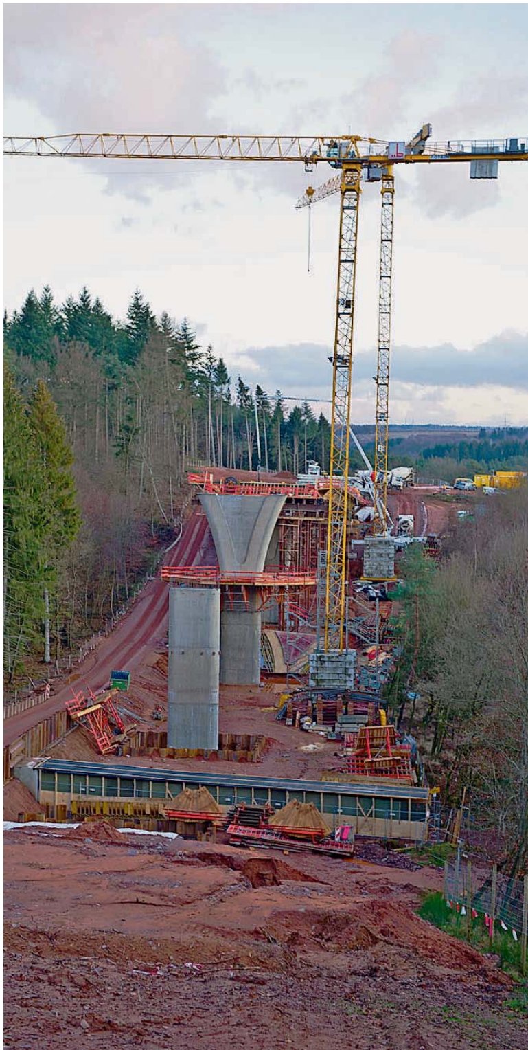
Das Brückenbauwerk während der Betonierarbeiten.

Erste größere Betonierarbeiten an Umgehung Besseringen