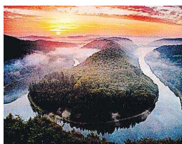
Beliebt bei Besuchern: Ziele im Kreis Merzig-Wadern.

Merzig-Wadern. Der Kreis Merzig-Wadern hat als einziger Landkreis im Saarland im vergangenen Jahr ein Plus sowohl bei der