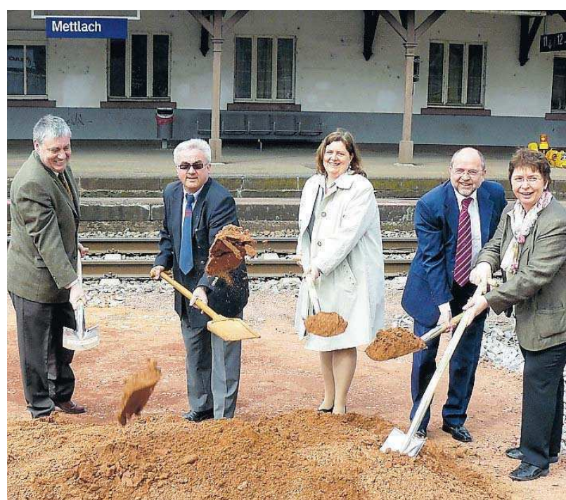
Gemeinsamer Spatenstich für einen barrierefreien Bahnhof.

Wie von der Bahn zu verfahren war, soll nach Abschluss des Projektes weitere Teile des Mettlacher Tunnels auf Vordermann gebracht werden. mst